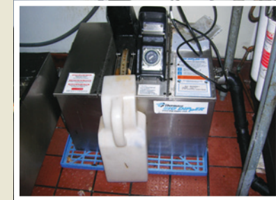
Ejemplo de trampa de grasa automática en el edificio