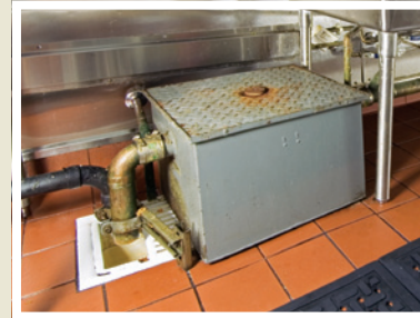
Ejemplo de trampa de grasa manual en el edificio